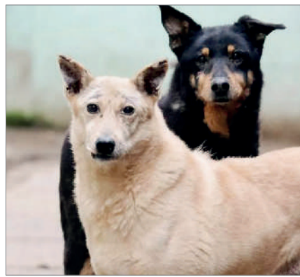
ҚАҢҒЫБАС ИТТЕН ҚАУІП КӨП