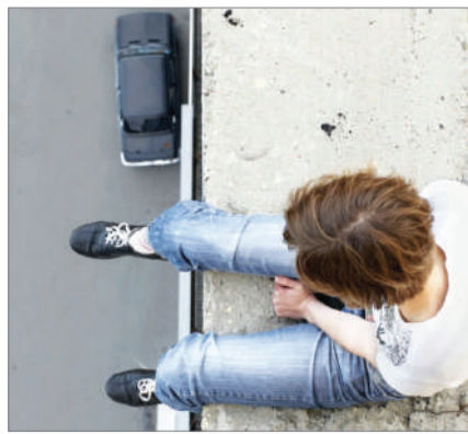
БАЛАЛАР ЕРТЕ СОЛМАСЫН