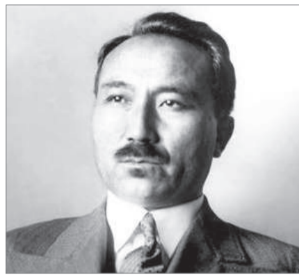
СӘКЕН ЖӘНЕ ҚАЗАҚ КӨСЕМСӨЗІ