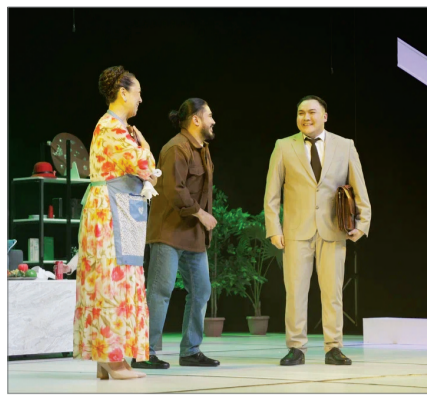
ҚАЗАҚЫ ТАҚЫРЫПТАҒЫ ҚОЙЫЛЫМ