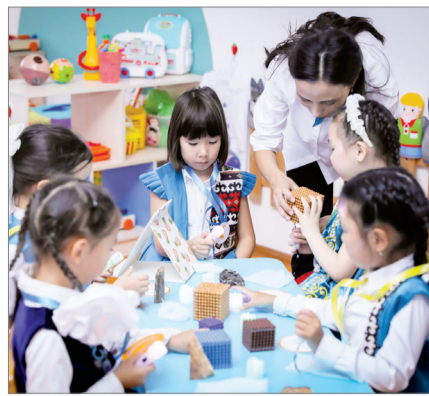
БОЛАШАҚ – БАЛАБАҚШАДА