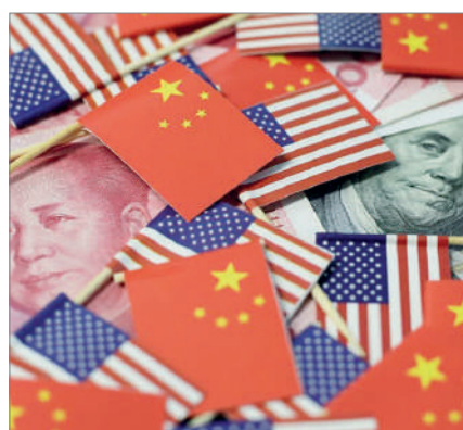
ЖАҒАНДЫҚ САУДА СОҒЫСЫ