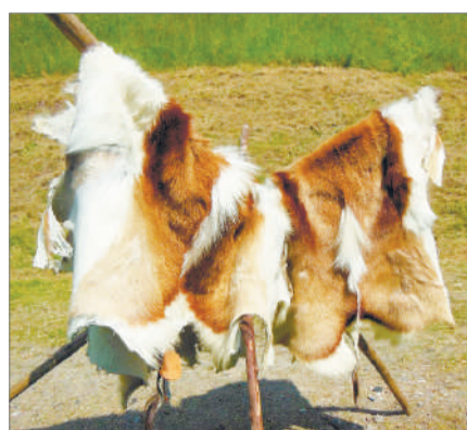
МАЛ ТЕРІСІ ДАЛАДА ҚАЛМАСЫН