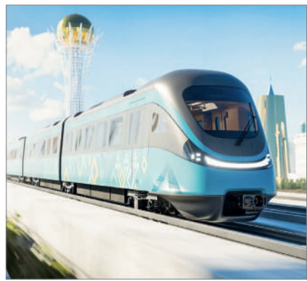
ЛРТ: ҚҰРАСТЫРУ БАСТАЛДЫ