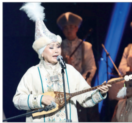
ҰЛТТЫҚ ӨНЕРДІ ҰЛЫҚТАҒАН САЙЫС