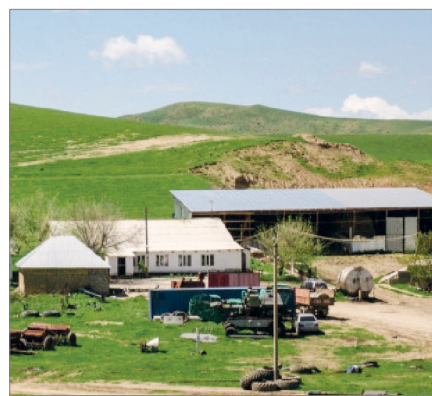
АУЫЛДАР НЕГЕ АЗАЙЫП БАРАДЫ?