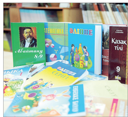
ОҚУЛЫҚ ТҮЗЕЛМЕЙ, ОҚУШЫ ӨЗГЕРМЕЙДІ