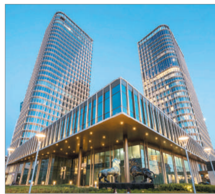
ЕЛОРДА – ІСКЕРЛІК ТУРИЗМ АЙНАСЫ