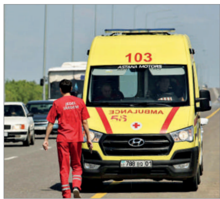
ЖЕДЕЛ ЖӘРДЕМ КӨЛІКТЕРІ КӨБЕЙДІ