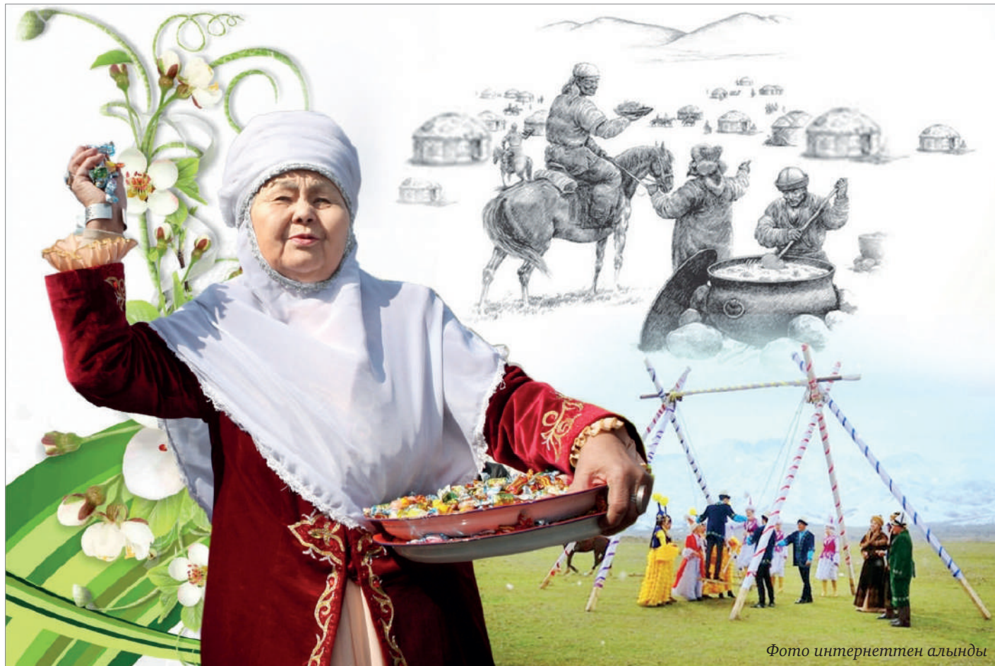
Фото интернеттен алынды

Наурыз мейрамын тойлау аясында әр ұйымда, оқу орындарында Шуақ