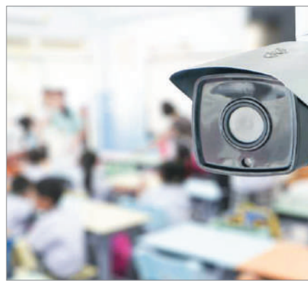
ЕЛОРДА МЕКТЕПТЕРІ: ҚАУІПСІЗДІК ҚАҒИДАТЫ