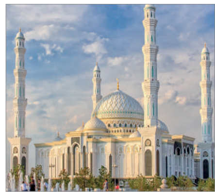
ОРАЗАНЫҢ СЫРЫ МЕН САУАБЫ