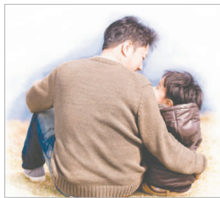
ӘКЕ – ОТБАСЫ ТІРЕГІ