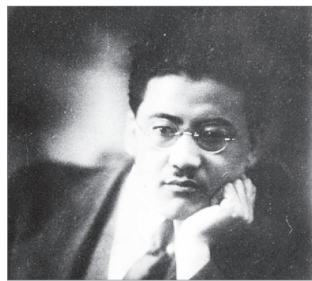
ШЫҢ МЕН ШЫНДЫҚ