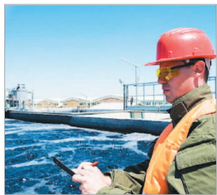
КАДРДЫҢ ҚАДІРІ БАР МА?