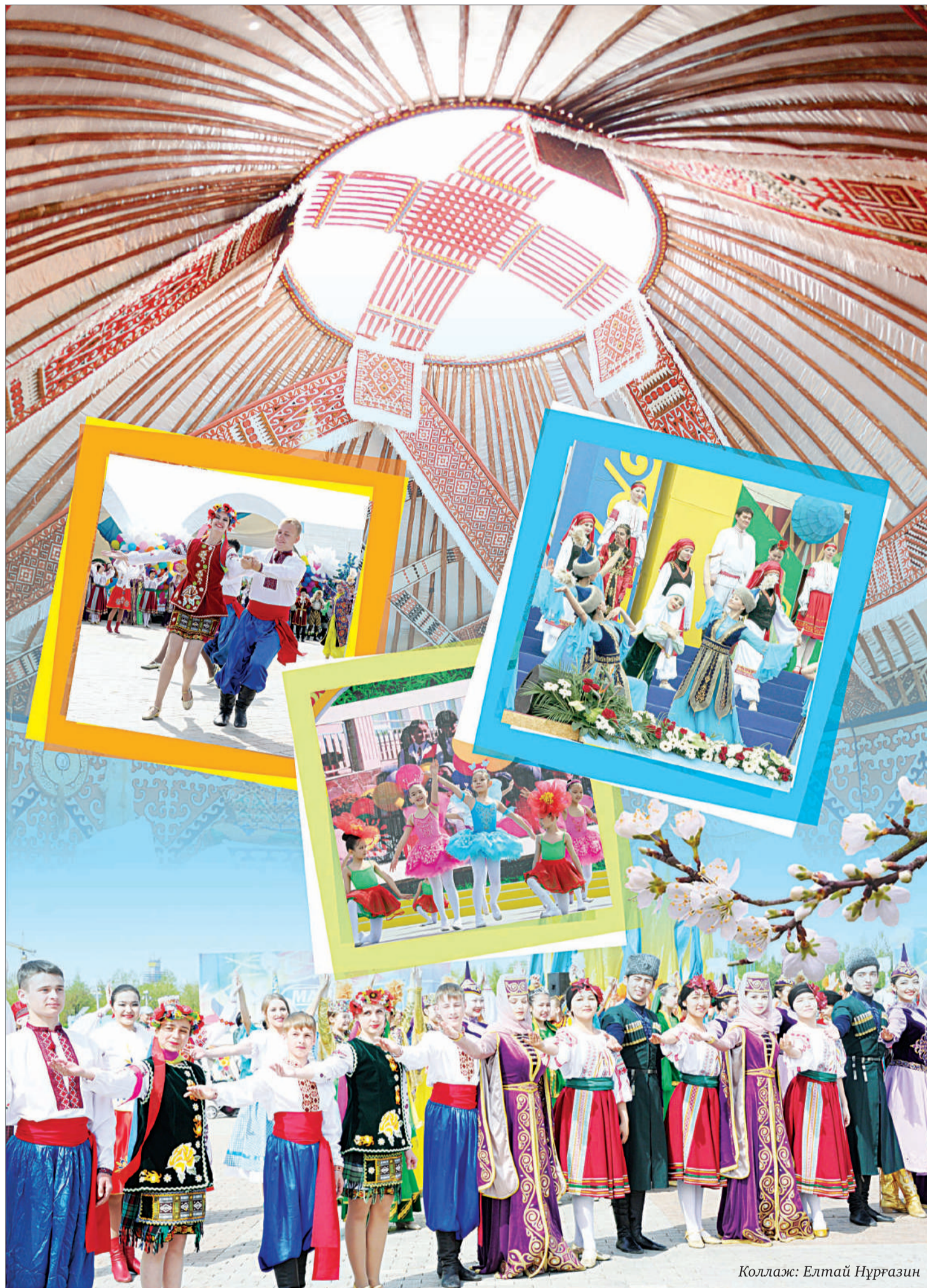
Коллаж: Елтай Нұрғазин

TV» телеарналарында 5 сағат тікелей эфирде тасқын басқан аумақты көзбен көріп, табиғи апаттан зардап шеккен тұрғындардың жан тебіренер оқиғалары айтылады. Ресми орган өкілдері апат салдарын жою бойынша мемлекет қабылдап жатқан шаралар туралы есеп береді. Эфир уақыты: 30 сәуір күні 17:00-ден 22:00-ге дейін.