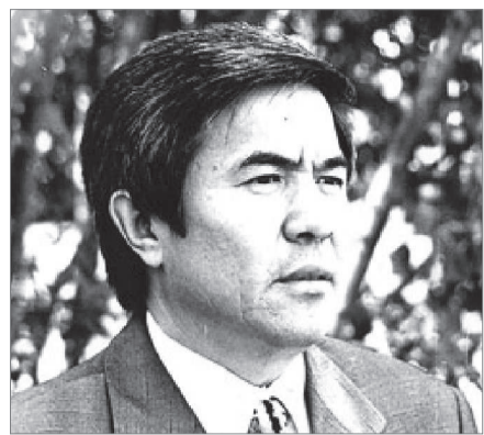
«ӨМІР – КЕРУЕН»