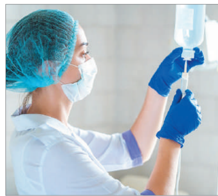
МЕЙІРІМІ МОЛ МЕДБИКЕ