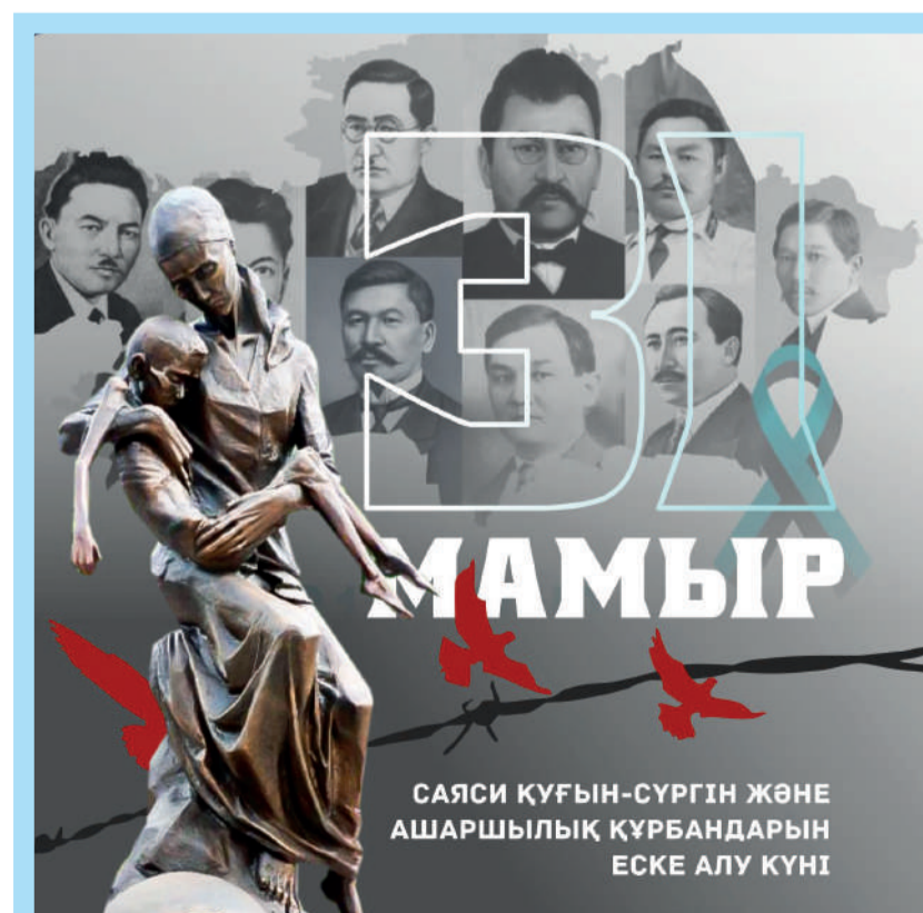
САЯСИ ҚУҒЫН-СҮРГІН ЖӘНЕ АШАРШЫЛЫҚ ҚҰРБАНДАРЫН ЕСКЕ АЛУ КҮНІ

Жазасын тартпайтын жамандық жоқ. Жүйең баласаң