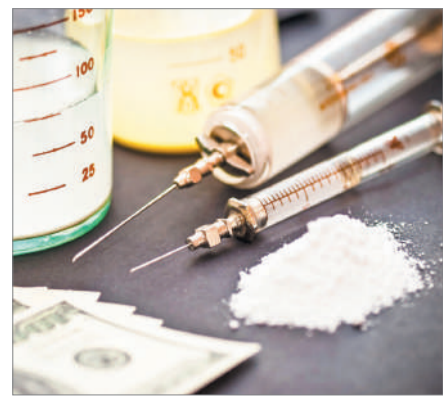
ЕСІРТКІСІЗ ҚОҒАМ – ЕЛДІК МІНДЕТ