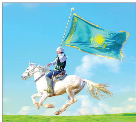
ҚАЗАҚ КӨТЕРГЕН КӨК ТҮ