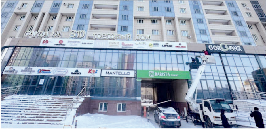
Улица Сыганак, 54 ЖК Номад