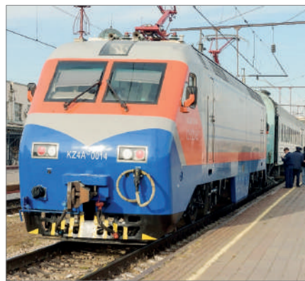
ТЕМІРЖОЛ БИЛЕТІ НЕГЕ ТАПШЫ?