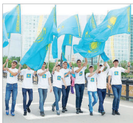
БЕЛСЕНДІ ЖАСТАР БЕЛЕСІ