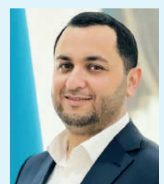
Ақбаржан ИСМАИЛОВ, Қазақстан халқы ассамблеясы төрағасының орынбасары: