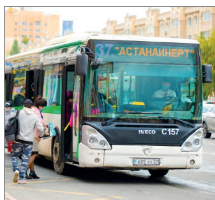
ҚОҒАМДЫҚ КӨЛІК ЖАЙЫ ҚАЛАЙ?