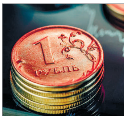
САНКЦИЯЛАР СОҒЫСЫНЫҢ САЛДАРЫ