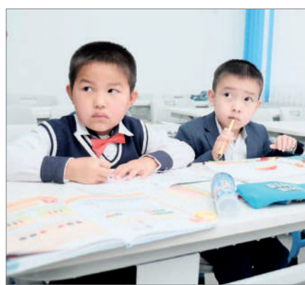
АУЫЛ БАЛАСЫ МЕГАПОЛИСТЕ ОҚИ АЛА МА?