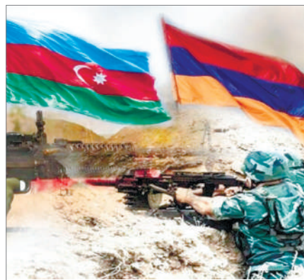
ҚАЙТА БАСТАЛҒАН ҚАҚТЫҒЫС