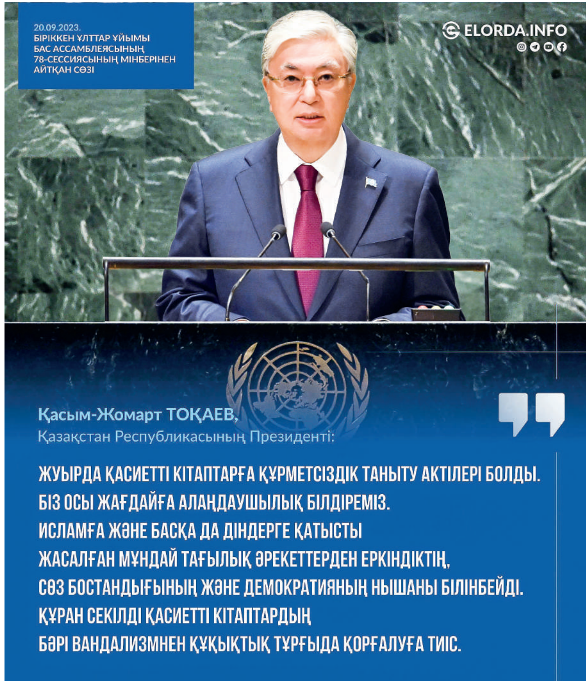
Қасым-Жомарт ТОҚАЕВ, Қазақстан Республикасының Президенті:

ЖУЫРДА ҚАСИЕТТІ КІТАПТАРҒА ҚҰРМЕТСІЗДІК ТАНЫТУ АКТІЛЕРІ БОЛДЫ. БІЗ ОСЫ ЖАҒДАЙҒА АЛАҢДАУШЫЛЫҚ БІЛДІРЕМІЗ. ИСЛАМҒА ЖӘНЕ БАСҚА ДА ДІНДЕРГЕ ҚАТЫСТЫ ЖАСАЛҒАН МҮНДАЙ ТАҒЫЛЫҚ ӘРЕКЕТТЕРДЕН ЕРКІНДІКТІ, СӨЗ БОСТАНДЫҒЫНЫҢ ЖӘНЕ ДЕМОКРАТИЯНЫҢ НЫШАНЫ БІЛІНБЕЙДІ. ҚҰРАН СЕКІЛДІ ҚАСИЕТТІ КІТАПТАРДЫҢ БӘРІ ВАНДАЛИЗМНЕН ҚҰҚЫҚТЫҚ ТҰРҒЫДА ҚОРҒАЛУҒА ТИІС.