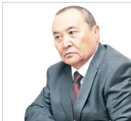
ЖАЗУШЫЛЫҚ – ҚАСИЕТ ПЕН ҚАСИРЕТ