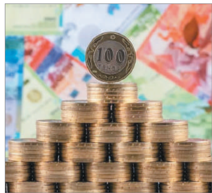
САЛЫМШЫНЫ САН СОҚТЫРҒАН