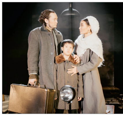
АЛТЫНШЫ МАУСЫМЫ АШЫЛДЫ