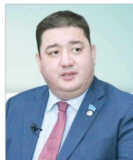
Ерлан КАНАЛИМОВ, Астана қаласы мәслихатының төрағасы: