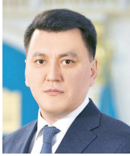
Ерлан ҚАРИН, ҚР Мемлекеттік кеңесшісі: