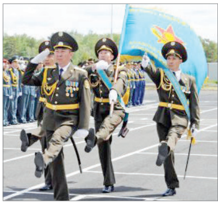
ӘСКЕРИ МАМАНДЫҚ ҚАЗАҚҚА ЖАТ ПА?