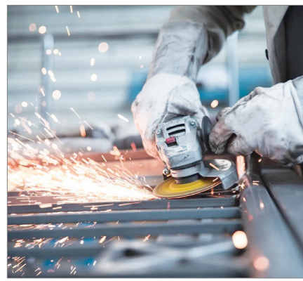
ЕҢБЕКТІ ҚАНАУ – ЕЛДІККЕ СЫН