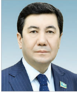
Ерлан ҚОШАНОВ, Мәжіліс төрағасы: