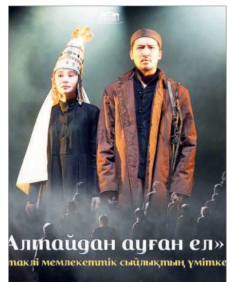
«Алтайдан ауған ел» мажбүр мемлекеттік сыйлығының үмітке

Мемлекеттік сыйлыққа ұсынылып, алдын ала іріктеуден өтіп, конкурстың келесі кезеңіне жіберілді. Ұлттық театрдың ұлттық қойылымы мемлекеттің жоғары марапатына лайық деп есептейміз.