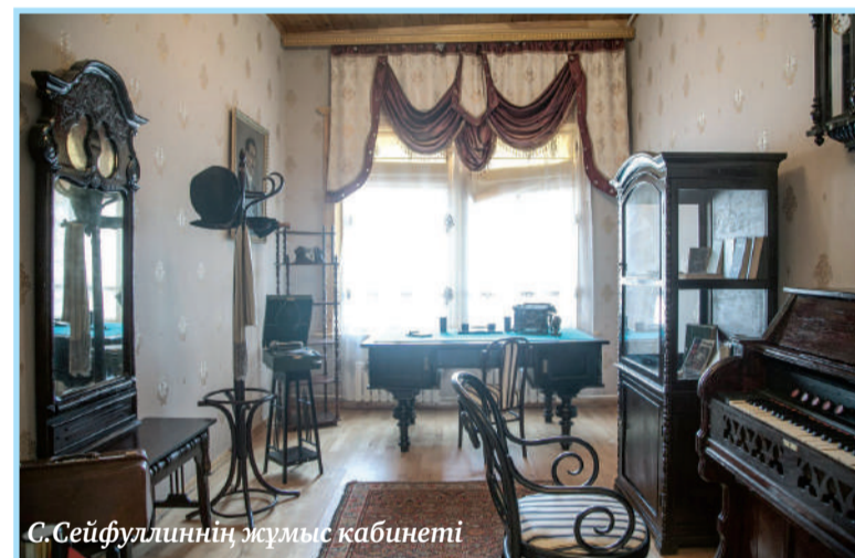
С.Сейфуллиннің жұмыс кабинеті