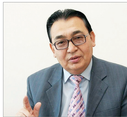
ЖАЛТАҚТЫҚ ЖАРҒА ЖЫҒАДЫ