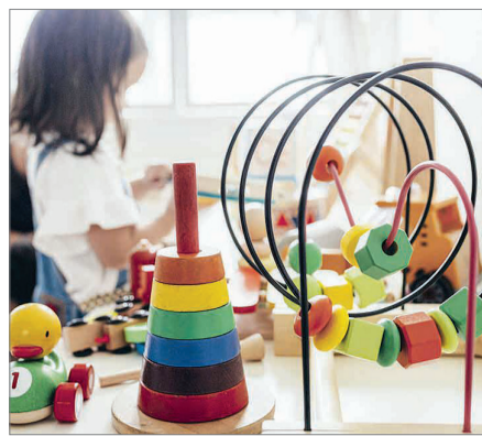
ОЙЫНШЫҚТАН «ОТ» ШЫҚПАСЫН