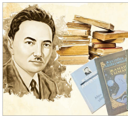
ҰЛТТЫ СҮЮГЕ ҮНДЕГЕН