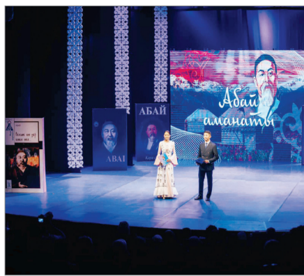
«ҰЛЫЛАР МЕКЕНІНЕН» – «АБАЙ АМАНАТЫНА»