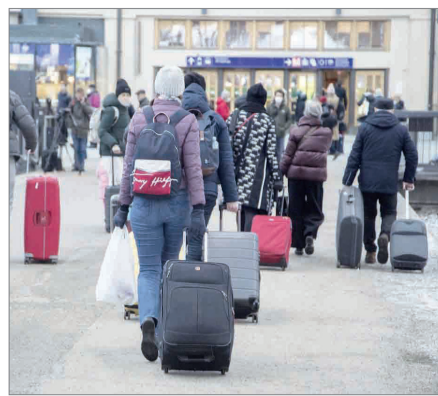
ЗЕЙНЕТКЕРЛЕР ҚАЛА ШУЫНАН ШАРШАМАЙ МА?