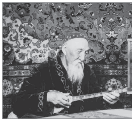
КЕНЕННІҢ ТАҒДЫРЛЫ ТАРИХЫ