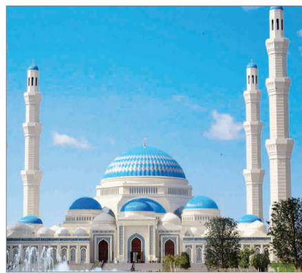
ШАМШЫРАҒЫҢ ІЛІМ БОЛСА АДАСПАСЫҢ