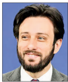
Фелипе Рамон Мороз Родригес, Бразилия Федералдық округі Мәдени мұраны қорғау министрінің орынбасары:

«Бұл – мерейлі белес. Біз ширек ғасыр бұрын астанамызды Алатаудың баурайынан Арқа төсіне көшірдік. Есідің жағасына ел қондырып, жаңа қаланың іргесін қаладық. Бүгін осы маңызды жиынға елорданың бұрынғы әкімдері, қаламыздың құрметті азаматтары, еңбек ардагерлері, мәдениет, ғылым, спорт қайраткерлері, ғалымдар, ұстаздар, мемлекеттік қызметшілер қатысып отыр. Олар Тәуелсіз Қазақстанның тірегі болған Астананың құрылысына белсене атсалысты, кеңес заманындағы ескі шаһардың қазіргі заманға сай озық қалаға айналуына зор үлес қосты. Мен баршаңызға шынайы алғыс айтамын. Шын мәнінде, Астана қаласының салынуы – Тәуелсіз Қазақстанның тарихында айрықша мәні бар оқиға болды. Өздеріңізге мәлім, елорданы көшіру оңай болған жоқ, қомақты жұмыс істелді. Бұл шешім өте күрделі кезеңде қабылданды. Ел экономикасы тоқырауда болды. Жұрт