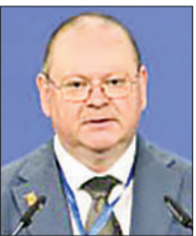
Олег МЕЛЬНИЧЕНКО, Пенза облысының губернаторы:

дами түсуіне мүмкіндік береді. Бауырлас қалалар форумының екіжақты қарым-қатынасты одан әрі дамытудағы маңызы зор. Бүгінгі іс-шара өзара қарым-қатынасымызды дамытуға арналған. Мен Қазақстан Президентіне бұл тарихи өзгерістердің жаңа дәуірі екенін түсінгені үшін алғыс айтуым келеді. Өйткені қазір әлемде түрлі сын-қатер болып, қалалар қиындықтарға тап болып жатқанын көріп отырмыз.