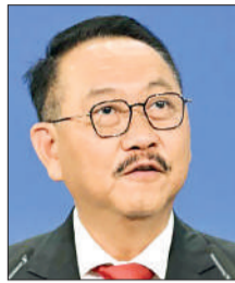
Бамбанг СУСАНТОНО, Индонезияның болашақ астанасы – Нусантара әкімшілігінің басшысы:

Форумның аясында бүгінгі таңдағы жаһандағы өсу мен инновациялардың негізгі орталықтары – қалаларды дамытудың ең өзекті мәселелері және оларды шешу жолдары талқыланды. Іскерлік бағдарлама шеңберінде әртүрлі сала бойынша 8 панельдік сессияның отырысы өтті.