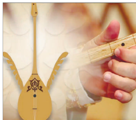
ҚАЗАҚ ОРКЕСТРЫ КҮЙ ТӨГЕДІ