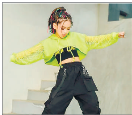
ҚЫЗДЫ КӨШЕ ТӘРБИЕЛЕЙ МЕ?