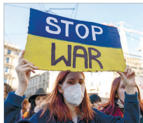
ҚАҚТЫҒЫС ӨРШИ МЕ, ӨШЕ МЕ?