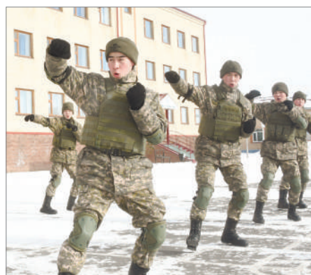
ӘСКЕРДІҢ БІР КҮНІ