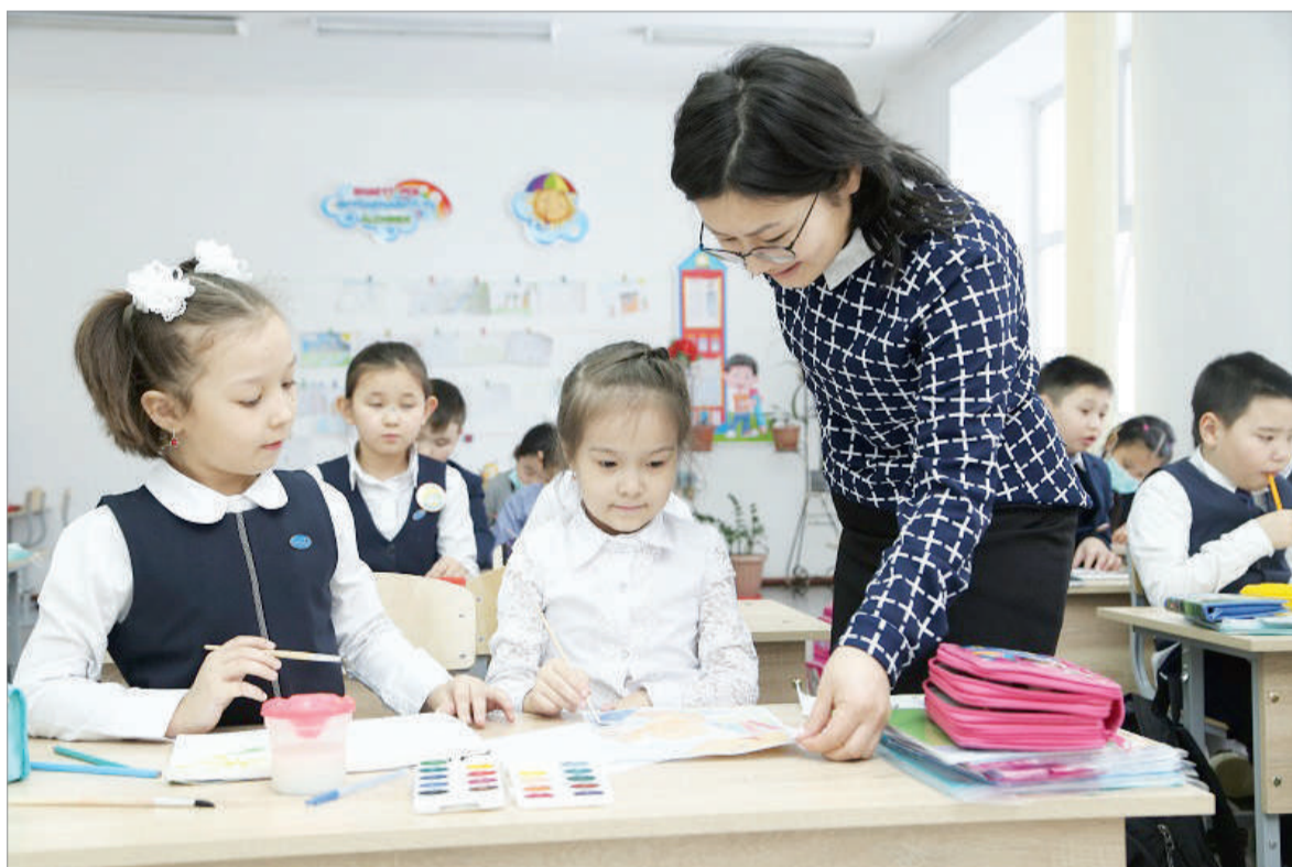
ЕЛОРДАМЫЗДЫҢ БІЛІМ БЕРУ ЖҮЙЕСİNДЕ 327218 БАЛАНЫ ҚАМТЫП ОТЫРҒАН 653 БІЛІМ ҰЙЫМЫ ЖҮМЫС ІСТЕУДЕ (243-І – МЕМЛЕКЕТТІК, 410-Ы – ЖЕКЕМЕНШІК)

Жалпы білім беретін мектептердің желісі жыл сайын артып келеді. Мәселен, соңғы 3 жылда 64500 орындық 36 мектеп пайдалануға берілді. Жыл сайын оқушылар контингенті 21 мыңнан артып отыр. Бұл жылына шамамен 10 мектепті пайдалануға беру керек дегенді аңғартады.