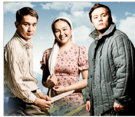
ҚАЙТА ОРАЛҒАН «ГАУЪАРТАС»