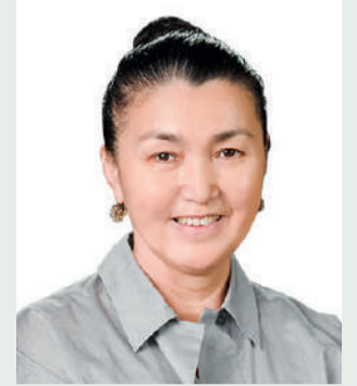
Роза МҰҚАНОВА, Мемлекеттік сыйлықтың лауреаты, жазушы-драматург: