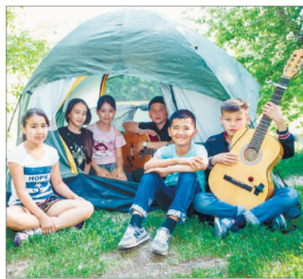
ЖАЗ МАУСЫМЫ ҚАУІПСІЗ БЕ?