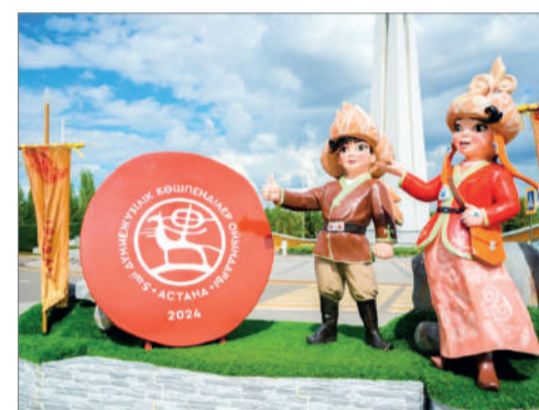
Президент Жарлығымен V Дүниежүзілік көшпенділер ойындарына атсалысқан азаматтар марапатталады.

Қазақстан Республикасы Президенті Қасым-Жомарт Тоқаевтың Жарлығымен Астана қаласында өткен V Дүниежүзілік көшпенділер ойындарының жүлдегерлері, олардың жаттықтырушылары, сондай-ақ халықаралық спорт шарасын ұйымдастыруға және өткізуге ерекше үлес қосқан азаматтар мемлекеттік наградалармен марапатталды. Көшпенділер ойындарын ұйымдастыруға және үздік нәтиже көрсеткен спортшылар қатарынан 1 адам «Парасат» орденімен және 7 азамат «Құрмет» орденінің кавалері атанды. «Ерен еңбегі үшін» медалі – 85, ал «Шапағат» медалі 5 адамға берілді.