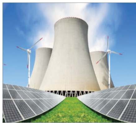
АЭС – ҚАУІПСІЗ ЭЛЕКТР ҚҰАТЫ