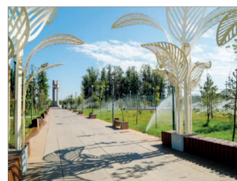
Астана аумағын абаттандыру ережелеріне өзгерістер енгізіліп, 13 жаңа тармақ қосылды.

Қазақстан Республикасы Президенті Қасым-Жомарт Тоқаевтың Жарлығымен Астана қаласында өткен V Дүниежүзілік көшпенділер ойындарының жүлдегерлері, олардың жаттықтырушылары, сондай-ақ халықаралық спорт шарасын ұйымдастыруға және өткізуге ерекше үлес қосқан азаматтар мемлекеттік наградалармен марапатталды. Көшпенділер ойындарын ұйымдастыруға және үздік нәтиже көрсеткен спортшылар қатарынан 1 адам «Парасат» орденімен және 7 азамат «Құрмет» орденінің кавалері атанды. «Ерен еңбегі үшін» медалі – 85, ал «Шапағат» медалі 5 адамға берілді.