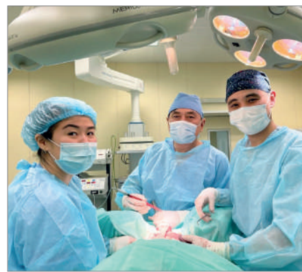
АЛТЫН ҚОЛДЫ ДӘРІГЕР