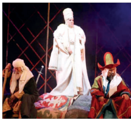
ТЕАТР – ЖҮРТҚА ОЙ САЛАТЫН ОРТА