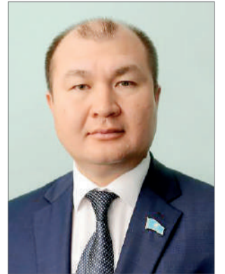
лық күш-жігерін жұмсайды деп санаймын.

Жоғарыда көрсетілген талаптарға сәйкес келетін үміткерлер депутаттыққа сайланған жағдайда, Қазақстанның өркендеуіне жол ашатын сауатты, әділ және пәрменді заңдарды шығару үшін бар-