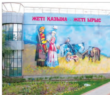
МУРАЛ МЕН МҰРА