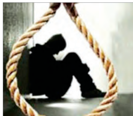
СУИЦИД НЕГЕ АЗАЙМАЙДЫ?