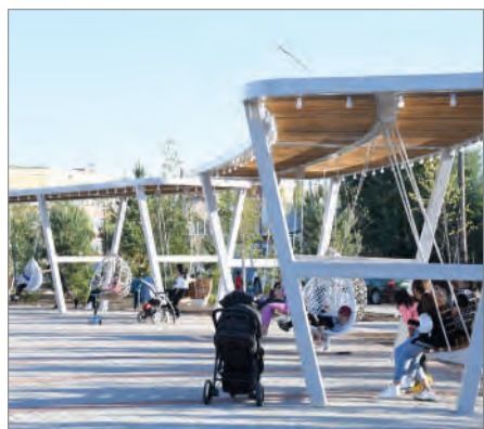
ЖАСЫЛ ЖЕЛЕКТІ АУЛАЛАР