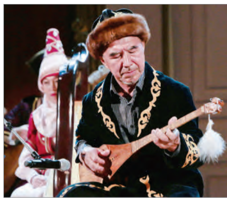
КҮЙ КҮМБІРЛЕГЕН КЕШ