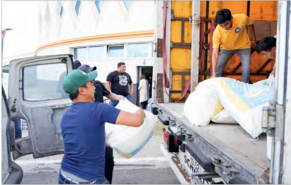
(Соңы. Басы 1-бетте)

Нұр-Сұлтан қалалық Қазақстан халқы Ассамблеясы қайырымдылық акциясына бастамашы болды. Оған елорданың этномәдени бірлестігінің өкілдері, ҚХА кәсіпкерлер қауымдастығы, Назарбаев университеті Жоғары бизнес мектебі түлектерінің қауымда-