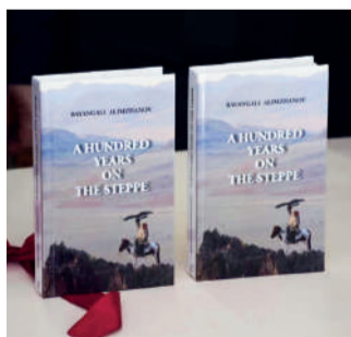
көпшілікке ұсынылды. Ізгілікті шараның

Көрмеге медицина саласы бойынша, әсіресе, пульмонология және жұқпалы аурулар жайында кітаптар мен мерзімді басылымдарда жазылған мақалалар қойылды. Сонымен бірге коронавирус пандемиясымен сырқаттанған науқастарды емдеп жазуда, батылдық пен төзімділік танытып, ерлік көрсетті деуге болатын ақ халатты абзал жандардың ғылыми еңбектері мен марапаттары, жеке заттары