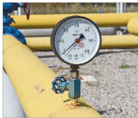
ГАЗДАНДЫРУ – ҮНЕМ КӨЗІ