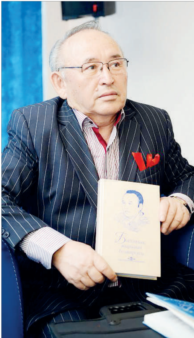
Несіпбек АЙТҰЛЫ, ақын, Мемлекеттік сыйлықтың лауреаты: