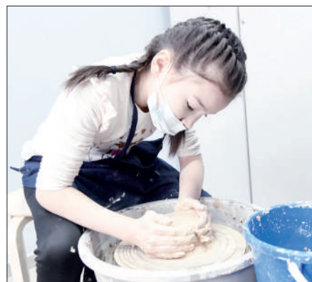
ҮЙІРМЕГЕ ҮЙІР БОЛ!