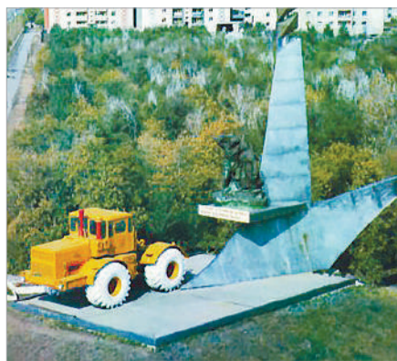
АЛЫП ТРАКТОР ТАРИХЫ