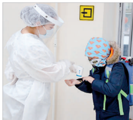
МЕКТЕПКЕ ҚАШАН ОРАЛАМЫЗ?