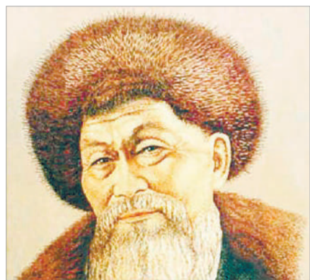
ЖАМБЫЛДАЙ ЖАҚЫН КІМІҢ БАР?