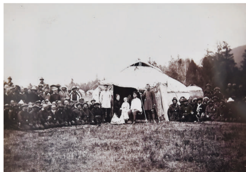
ФОТО ТІЛІНДЕ – ТӘУЕЛСІЗДІК

Талдықорғандағы «Атамекен» көрме кешенінде Тәуелсіздіктің 30 жылдығына және облыс орталығының Талдықорған қаласына көшкеніне 20 жыл толуына орай белгілі фотографтар Шүкір Шахай мен Жеңіс Ысқабайдың «Тәуелсіздік – ақ ордам, Талдықорған – бақ ордам» атты бірлескен сурет көрмесі өтті.