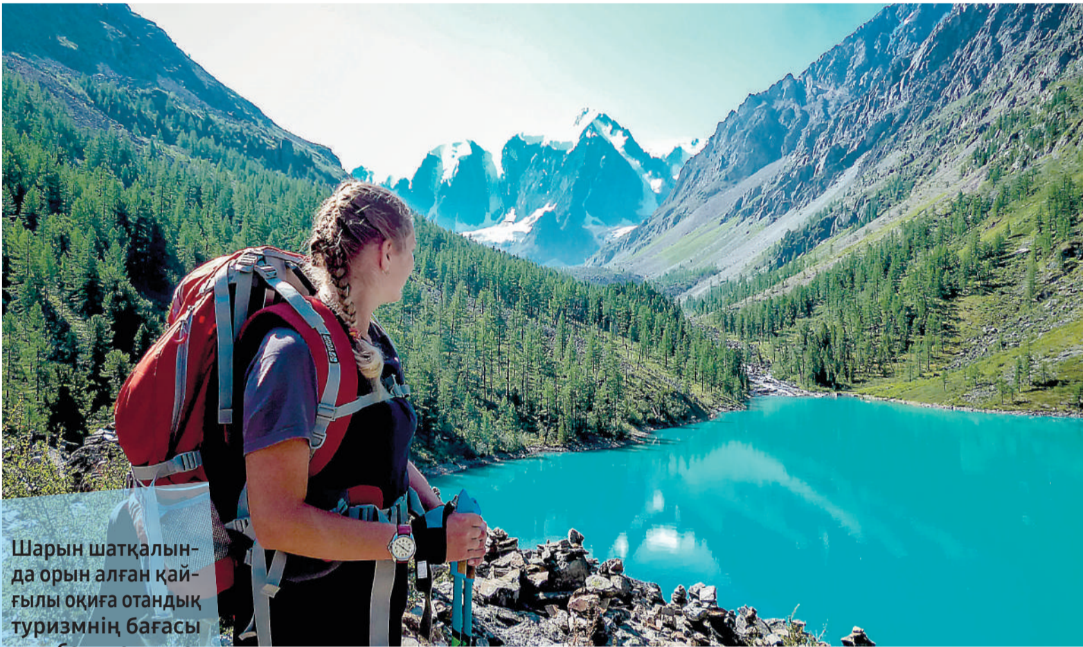
Шарын шатқалында орын алған қайғылы оқиға отандық туризмнің бағасы қымбат, жолы жаман, қызмет көрсету сапасы төмен дегенге беретін тізімге қауіпсіздіктің қадағаланбайтынын қосып берді. Экскурсия барысында адам өлімі болды. Сел болмағанда жыл – он екі ай жүздеген турист баратын танымал нысанда сақтық шараларының сақталмайтынын ешкім ескермес пе еді... Бір жыл бойы жүріс-тұрысы әбден шектелген, санасын үрей билеген жұрт биыл қайда барып шаршағанын басады? COVID-19 келгені туризм саласы тұйыққа тірелді. Жаз болса шетел асатын қазақстандықтар қалаған еліне кете алмады. Тур бағасы артып, туристерге қойылар талап күшейді. Есесіне ішкі туризмнің жандануына жол ашылды. Ендігі мәселе – еліміздегі саяхат дамудың даңғыл жолын табу ма? Жалпы отандық туризмнің тағы қандай күрмеулі тұстары бар? Бурабайға барғандар неге ашуға булығып қайтты? Зерттеп көрдік.