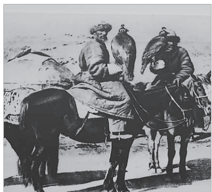
ҰЛЫ ДАЛА – АЛЬФРЕДТИҢ КӨЗІМЕН