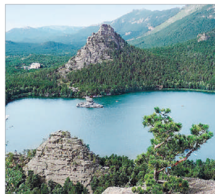
ҚАЗАҚСТАНДЫҚТАР ҚАЙДА ДЕМАЛАДЫ?