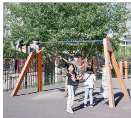
АУЛА НЕГЕ ТАРЫЛДЫ?