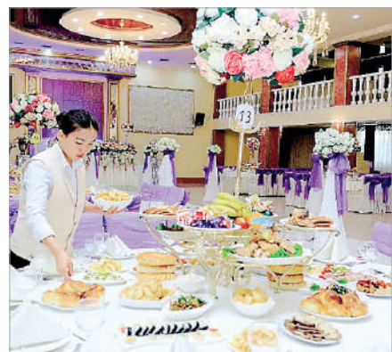
ТОЙ КЕМІМЕЙ, ОЙ КӨБЕЙМЕЙДІ