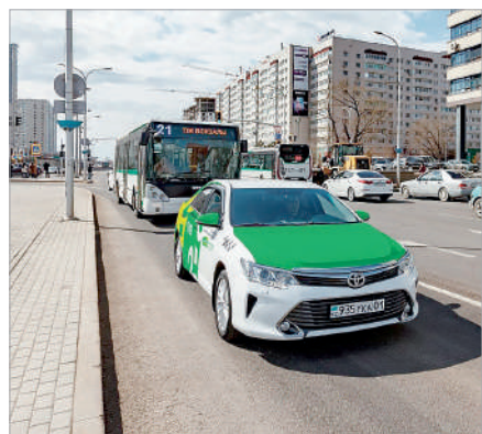
МАҢЫЗДЫ ЖОБАЛАР ЖАЙЫ ҚАЛАЙ?