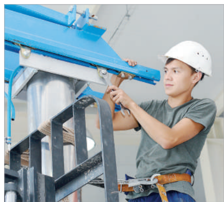
ҚАЙ МАМАНДЫҚ ҚАТ БОЛЫП ТҮР?