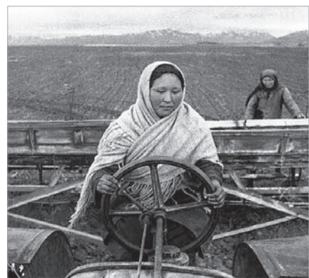
ЖЕҢІС ТЫЛЫ – ҚАЗАҚСТАН