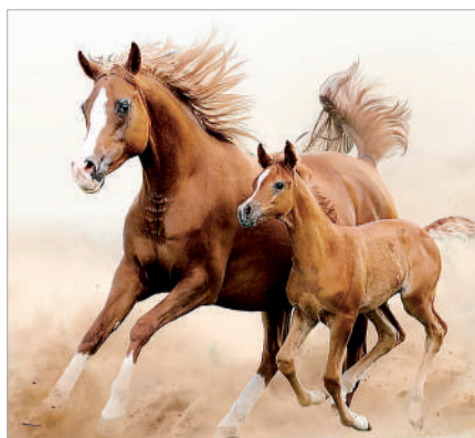
ТЕКТИНІҢ ҚАСИЕТІН ЖОҒАЛТПАЙЫҚ...