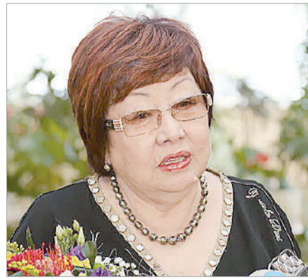
КІСІЛІК ПЕН МЕЙІРІМДІ САҒЫНАМЫН