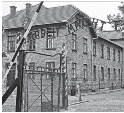
ТҮТҚЫННЫҢ ТАЛАЙСЫЗ ТАҒДЫРЫ...