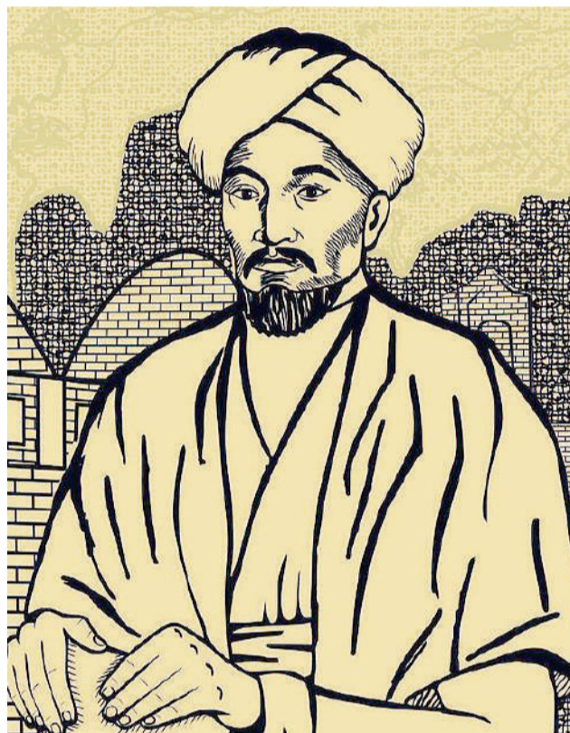
Ғылым адам санасына болмысы бөлек, ерекше ұтқыр ұғымдарды орнықтыру арқылы ғана терең ұялайды.

– Иә, солай деңіз, ал мен болсам X ғасырда өмір сүрдім, менен соң олар өмірге келетінін қайдан білейін, – дей