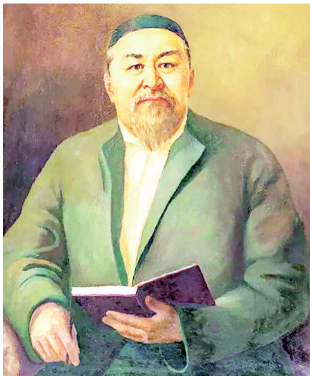
Адамның көңілі шын мейірленсе, білім-ғылымның өзі де адамға мейірленіп, тез қолға түседі. Шала мейір шала байқайды.

ни ерлік, қайталанбас кісілік» деп баға берген көрінеді. Бірақ «саяси сенімсіз» адамның романын жариялап, оны мақтап мақала жазды» деген желеумен Б.Кенжебаев Орта-