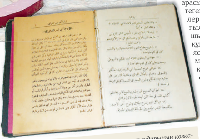
Әбу Насыр әл-Фарабидің «Ізгі қала тұрғындарының көзқарасы туралы» трактатының айқара беті. Мысырдың «Ніл» баспасы, 1907 жыл. Бұл трактатта «Әбу Насыр әл-Фараби Фарабта туған» деп қадап жазылған

Тақырыптың экспозициялық шарты оның музейлік заттармен қамтамасыз етілуі десек, мұражай қорында тас дәуірінің тарихына қатысты Отырар шұратындағы Жаңашілік-1-3 тұрақтарынан табылған тастан жасалған құрал-саймандар, палеометалл, қола, ерте темір дәуірінің тарихына қатысты дәнүккіш, тас келсап, қыш тостаған, қыш саптыақтар, құмыра, таңбалы тас, балбал тас, Қорқыт