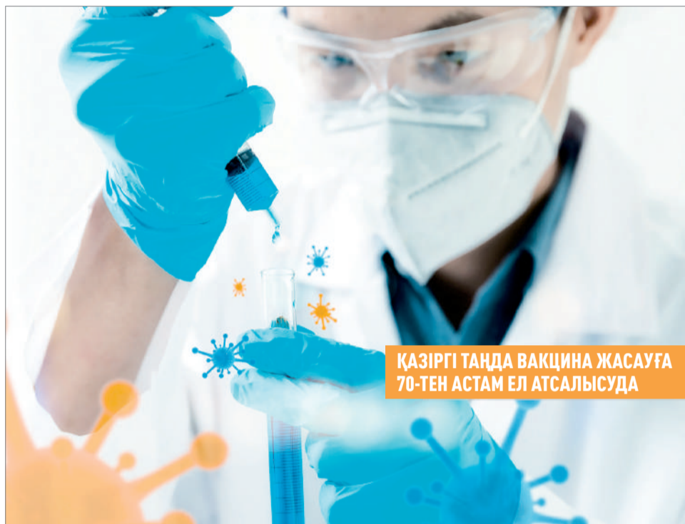
ҚАЗІРГІ ТАҢДА ВАКЦИНА ЖАСАУҒА 70-ТЕН АСТАМ ЕЛ АТСАЛЫСУДА

» Өлемнің 216 елін әлекке салған COVID-19 індетінің ойраны оңай болмай тұр. Атап айтқанда, жаһанды жалмаған вирусты 18 миллионнан астам адам жұқтырып, 690 мың адам бақилық болды. 11 миллионнан астамы сауығып шықты. Дендеген дерттің әзірге беті қайтар түрі жоқ. Кейбір елдер екінші толқынына дайындалып жатыр. Ал ДДҰ мамандары болса адамзат аты жаман аурумен кемінде әлі екі жыл күреседі деп отыр. Осы жағдайға байланысты жаһан жұртшылығы дертке қарсы екпенің ертерек дайындалуын төрт көзбен күтіп отыр.