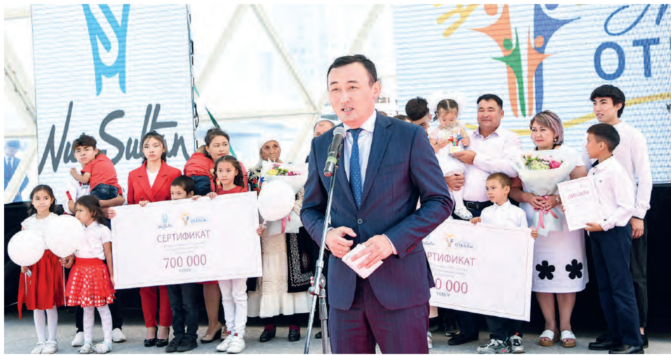
(Соңы. Басы 1-бетте)

Елбасы Н.Ә.Назарбаевтың бастамасымен «Мерейлі отбасы» ұлттық байқауы биыл сегізінші жыл қатарынан өткізіліп отыр. Жыл сайын байқау үш деңгейде (аудандық, облыстық және республикалық) ұйымдастырылып келеді. Дәстүрге айналған ұлттық байқаудың негізгі мақсаты – еліміздегі үлгілі жанұяларды дәріптеп қана қоймай, олардың өнегелі өмірін кейінгі жастарға кеңінен насихаттау, отбасы институтын нығайту, ата-ананың