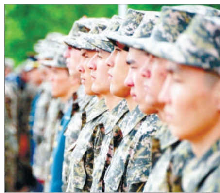
ӘСКЕРДЕГІ ӘЛІМЖЕТТІК ҚАШАН ТОҚТАЙДЫ?