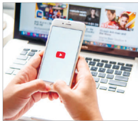
ҚАЗАҚША КОНТЕНТ САПАЛЫ МА?