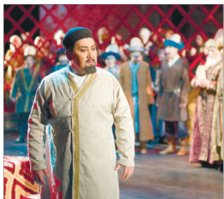
МӘДЕНИЕТ САЛАСЫНДА МӘСЕЛЕ КӨП...