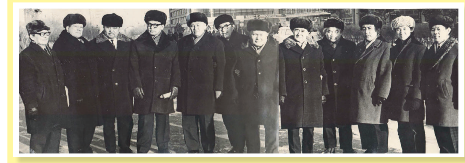
Ақын-жазушылар апталықтың алғашқы күні таңертеңгі 11.00-де Саяси ағарту үйінде облыстағы шығармашылық жастармен, жас талап әдебиетшілермен кездесіп, семинар өткізді.

1970 жылы 10 желтоқсанда Қазақстан Жазушылар одағының секретары, Қазақ ССР Мемлекеттік сыйлығының лауреаты Жұбан Молдағалиев бастаған бір топ ақын-жазушы «Қазақстан поэзиясының апталығын» өткізу үшін Целиноград қаласына келді.